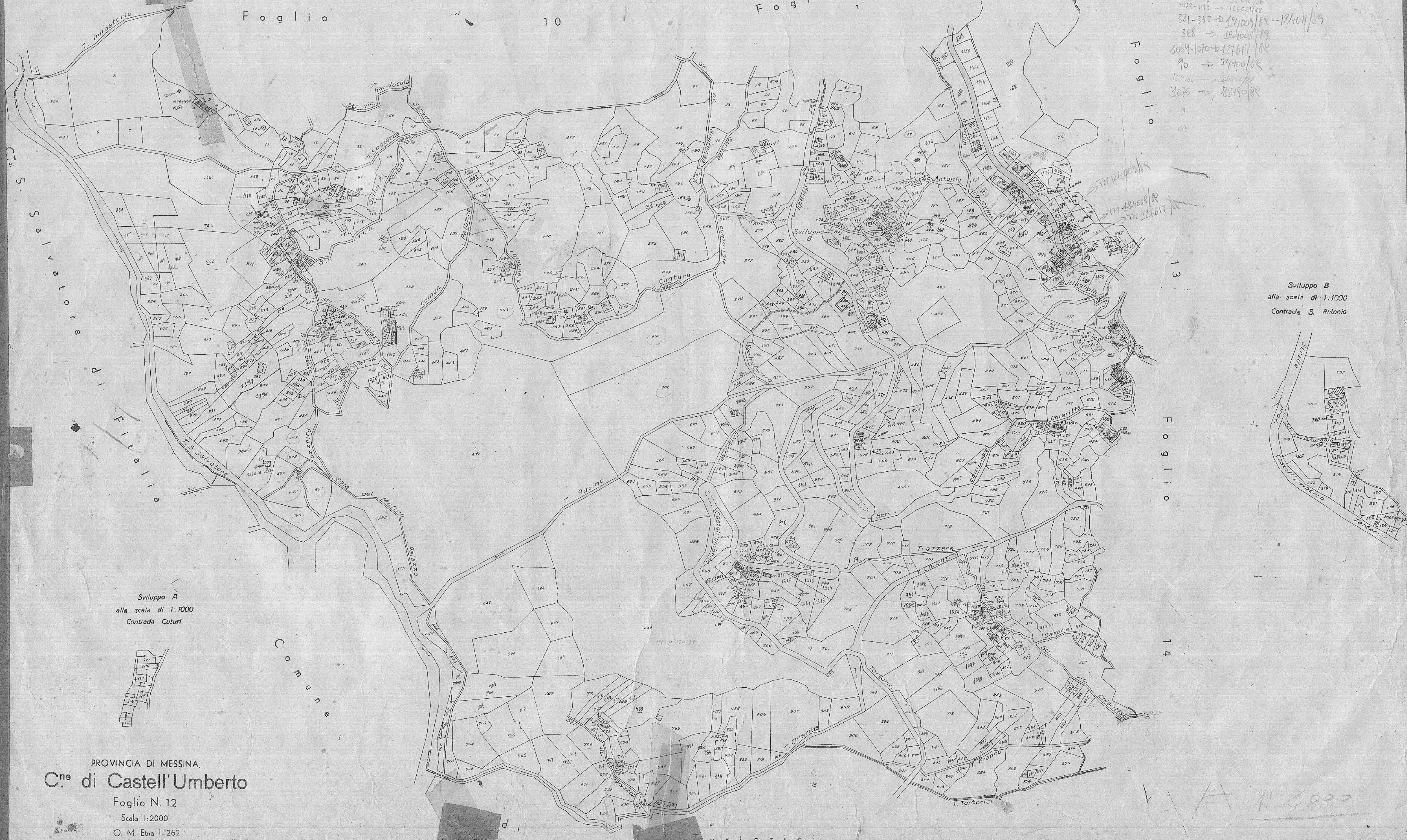
Sviluppo B alla scala di 1:1000 Contrada S. Antonio